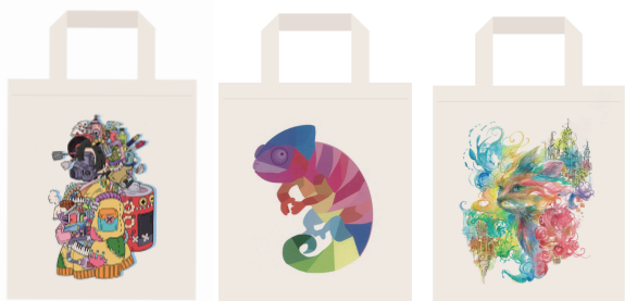
トートバッグのデザイン例は昨年の受賞作品です